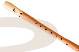
il flauto dolce