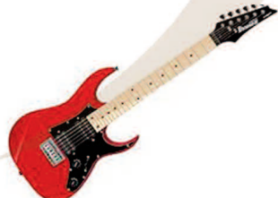
la chitarra elettrica