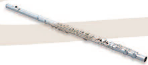
il flauto traverso