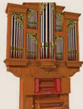
l'organo a canne